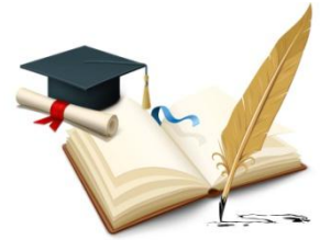
图 4 XXX

➤ 结果 2 结论中的内容包括对本文中的方的总结和对仿真实验或实例的分析,及本文结果对该领域研究的作用及贡献。