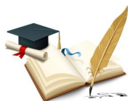
图 2 XXX