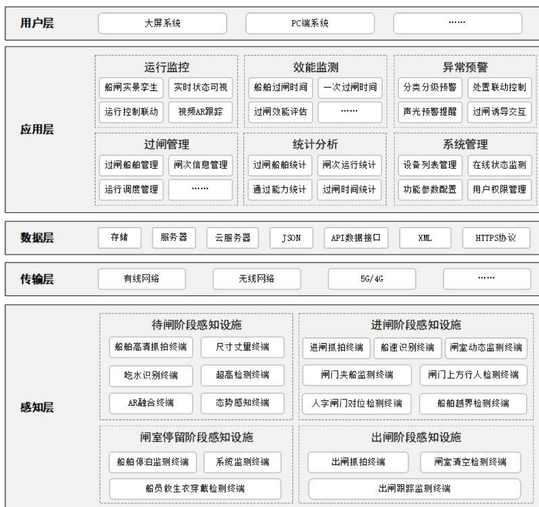
图2 系统总体架构图